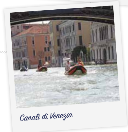
Canali di Venezia

Tel. +41 (0)91 600 33 44 E-mail info@asconavenezia.org Internet www.asconavenezia.org