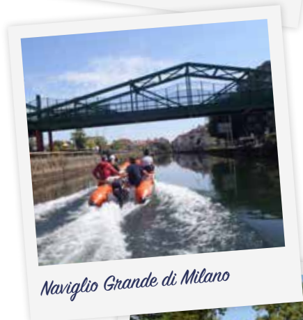
Naviglio Grande di Milano