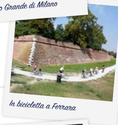
In bicicletta a Ferrara